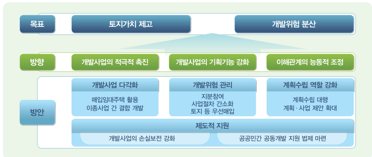
그림 4 공공사업시행자의 역할 재정립 방안