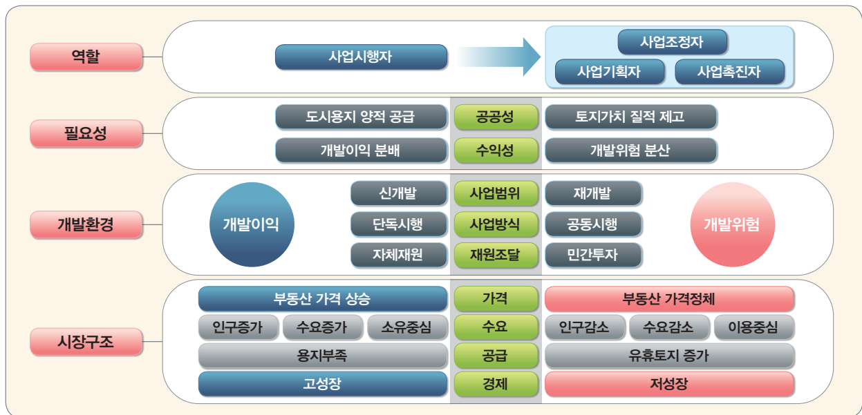
그림 3 공공사업시행자의 역할 재정립 필요성